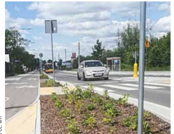
Odcinek Traktu Lubelskiego, który był przebudowywany w trzeciej, ostatniej kolejności