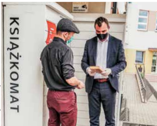
Wawerska Biblioteka Publiczna wzbogaciła się o dwa nowe książkomaty. Na zdjęciu ten zainstalowany przy SP nr 109, którego użyteczność sprawdził burmistrz Norbert Szczepański