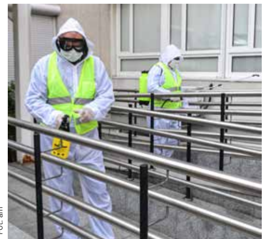
Zastępca burmistrza i radny w akcji ozonowania