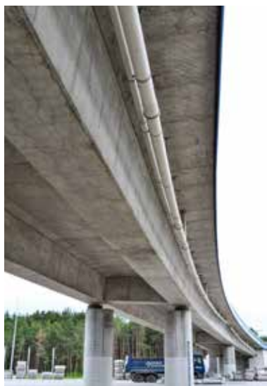
Oddany do użytku wiadukt w ciągu ul. Zabawnej