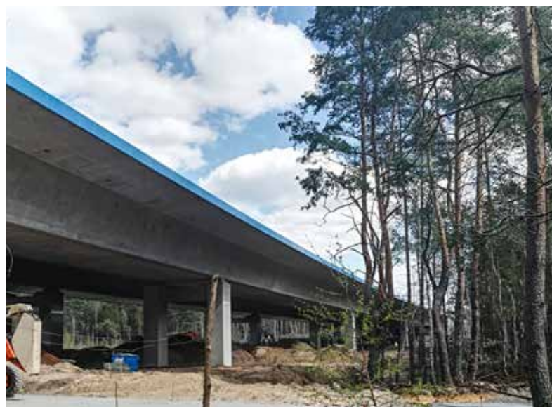
Budowa obwodnicy na terenie Mazowieckiego Parku Krajobrazowego