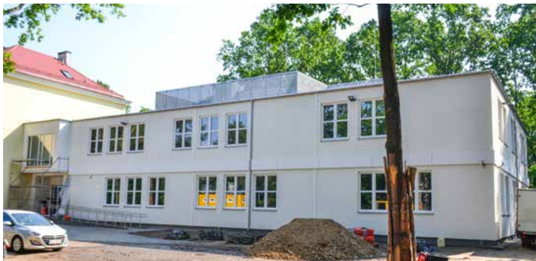
Dwukondygnacyjna przybudówka SP nr 218 w Aninie