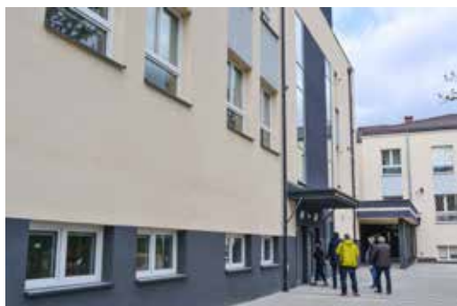
Nowe skrzydło SP nr 124 w Falenicy

Te inwestycje to budowa nowych skrzydeł w Szkole Podstawowej nr 218 w Aninie i Szkole Podstawowej nr 124 w Falenicy oraz budowa zespołu szkolno-przedszkolnego w Nadwiślu. Wizytowali je burmistrz Norbert Szczepański oraz jego zastępca Leszek Baraniewski, rozmawiali z wykonawcami o stanie zaawansowania prac oraz z dyrektorkami szkół o tym, jak oceniają zaprojektowane rozwiązania architektoniczne i o ewentualnych potrzebach, choćby w zakresie wyposażenia.