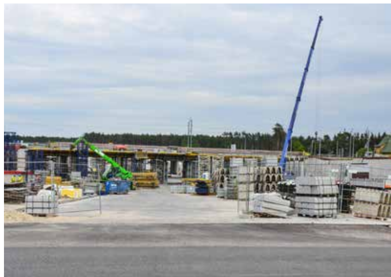
Teren budowy przejazdu pod torami kolejowymi w Miedzeszynie

Wkrótce oddany będzie do użytku drugi wiadukt – przy ul. Mozaikowej. W połowie czerwca był już odpowiednio oznakowany. Po torach nad odkrytą wanną w węźle Patriotów kursują pociągi. Jadąc zachodnią nitką ul. Patriotów, korzystamy już z gotowych ślimaków. Stąd widać w kierunku wiaduktu na Mozaikowej, że jezdnie pokryte kruszywem przygotowane są do asfaltowania.