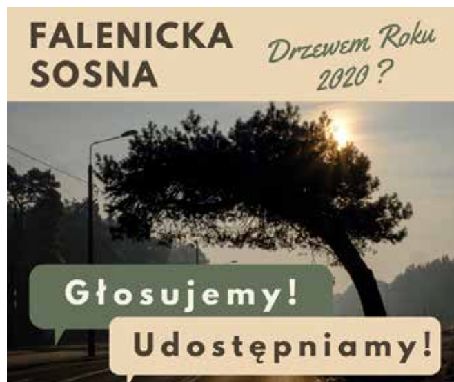
Uratowano ją przed siekierą kolejarzy, walczy o tytuł Drzewa Roku

W tegorocznej odsłonie konkursu w szranki stanęło szesnastu kandydatów. Dotychczasowe głosy dają naszemu miejscu na podium, ale warto jeszcze raz zewrzeć wokół naszej sosny szyki, żeby zagwarantować jej puchar i tym samym otworzyć drogę ku międzynarodowej karierze w europejskiej edycji tego konkursu. Jej zwycięstwo zależy wyłącznie od mobilizacji internautów. Głosować można do 30 czerwca na stronie konkursu: drzeworoku.pl mas