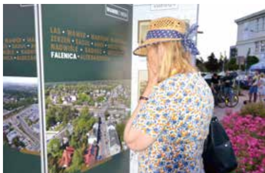
Mieszkańcy interesowali się okolicznościową wystawą, na której znalazły się historyczne informacje i zdjęcia zestawione ze współczesnymi