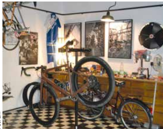
W prowadzonym przez Kamila Błachnio serwisie rowerowym dawne rowery uzyskują dawny blask