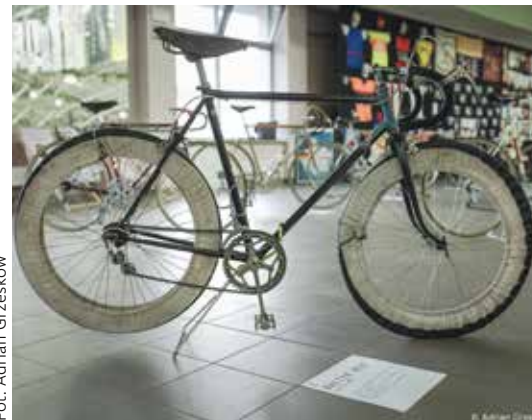
Najstarszy egzemplarz – kolarski Bałtyk R15 z ponad siedemdziesięcioletnią historią