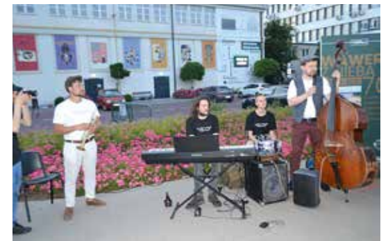
Powstający dzięki stypendium burmistrza zespół Werwa Wawer przypomniat zgromadzonym, że Wawer ma swój hymn

Uroczystemu zapaleniu neonu towarzyszyła wystawa przedstawiająca wawerskie osiedla