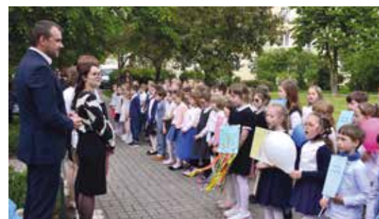
Uczniowie SP nr 195 przyszedli na odsłonięcie pamiątkowej tablicy z hasłami, jakie Janusz Korczak propagował w ich imieniu

Uczniowie SP nr 195 przygotowali na tę okoliczność program artystyczny, w którym była mowa o tym, że dzieci mają swoje prawa, takie jak prawo do szczęścia, radości, do wypowiedzenia swoich myśli i uczuć, ale także do niewiedzy, własności, tajemnicy. Te prawa, przynależne