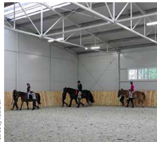
Nowy obiekt TPOD „Helenów” umożliwi rehabilitację niepełnosprawnych także zimą