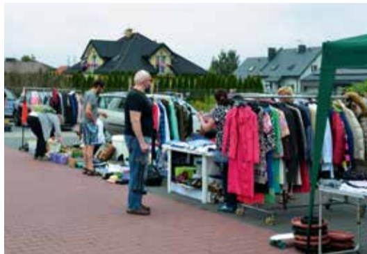
Pierwszą wyprzedaż umownie nazywaną garażową zorganizowano na przykościelnym parkingu