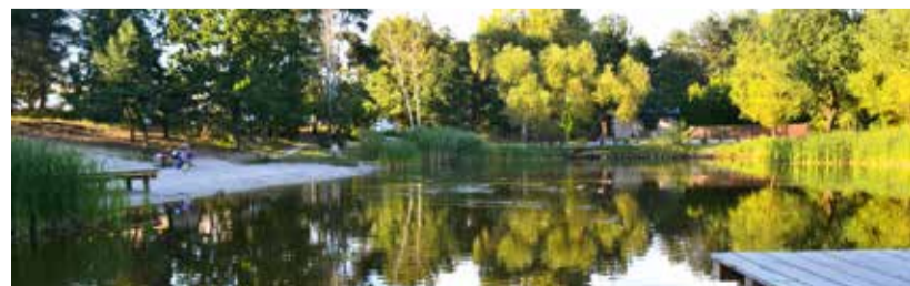
Morskie Oko w Aleksandrowie z zagospodarowanym rekreacyjnie brzegiem

Miłośnikom spędzania czasu na łonie przyrody polecamy piesze i rowerowe szlaki na terenie Mazowieckiego Parku Krajobrazowego (o ich urokach pisaliśmy w nr 9 i 10 „Kuriera”) i odwiedzenie zagospodarowanego Morskiego Oka w Aleksandrowie. Warto odwiedzić ośrodek TPD „Helenów” przy ul. Hafciarskiej, gdzie można pojeździć konno. Jest tam wioska indiańska oraz mini-zoo. Polecamy wybrać się do siedziby Lasów Miejskich na pograniczu Wawra i Wesolej (od ul. Jagiellońskiej), gdzie można w ciszy wypocząć nad niewielkim stawem i poznać tamtejszą przyrodniczą ścieżkę edukacyjną. am