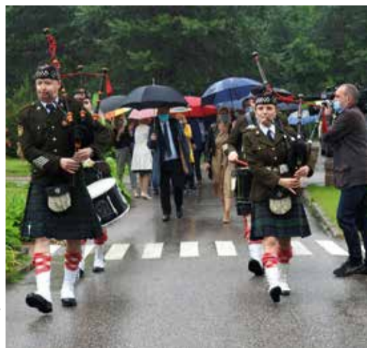
Otwarcu hali do hipoterapii towarzyszył przemarsz kobziarzy