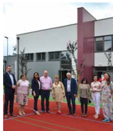
Goście nowego obiektu oświatowego w Wawrze na jego sportowo rekreacyjnym terenie

uczniów, głównie z Wawra. Placówka ta jest na wskroś nowoczesna, posiada pracownię do terapii i zajęć z integracji sensorycznej, gabinety pedagogiczny, logopedyczny, pielęgniarski, zespół boisk, siłownię.