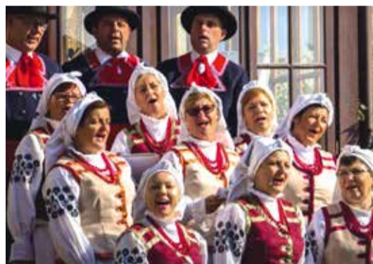
Członkinie zespołu URZECZENi z Góry Kalwarii w tradycyjnych regionalnych strojach ludowych

Podczas Zielonych Świątek na Urzeczu on-line nie mogło zabraknąć elementów artystycznych.