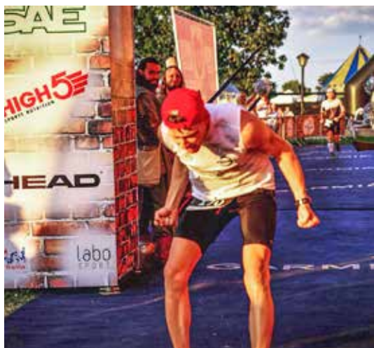
Meta na zawodach Ironman – Kuba maksymalnie wyczerpany

Jego życiowe sukcesy? Pisaliśmy już o nich na łamach „Kuriera”. Warto je przypomnieć.