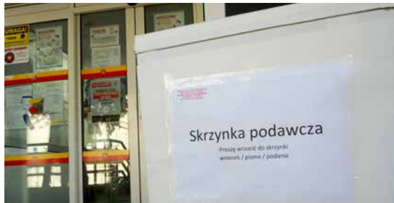
Przed wejściem do budynku Urzędu Dzielnicy umieszczona jest tymczasowa skrzynka podawcza na składane przez mieszkańców dokumenty

Rząd pracuje także nad rozszerzeniem tzw. Tarczy Antykryzysowej. Na razie przedsiębiorców, pracowników i rolników obowiązuje wersja