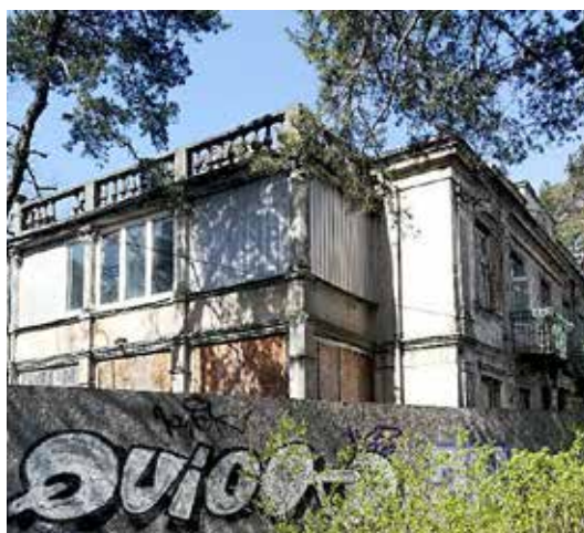
Dofinansowania wymaga wiele wawerskich zabytków, tak jak Willa pod Kogutkiem w Radości, przed laty należąca do aktora komediowego Antoniego Fertnera

Prace muszą być prowadzone w jednym roku kalendarzowym tak, aby mogły być rozliczone do 10 grudnia. Dlatego zaleca się ich etapowanie,