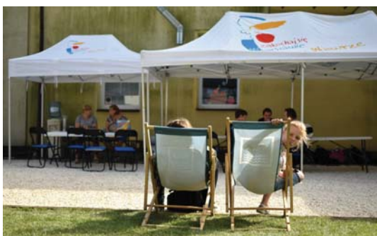
Czytelnia plenerowa w Miedzeszynie

Harcerze ze Szczepu „Błękitni” 147 WDHIGZ cieszą się, gdyż udało się zakończyć modernizację harcówki w ZS nr 114 przy ul. Alpejskiej.