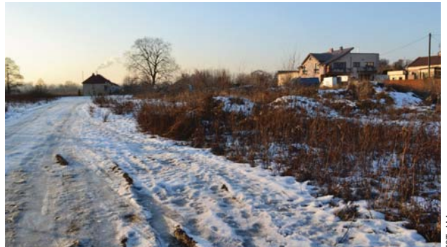
Teren budowy przyszłego zespołu żłobkowo-przedszkolnego, która ruszy gdy już zima odpuści

Część przedszkolna na II piętrze będzie się składać z czterech sal do zajęć ruchowych, po-