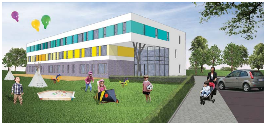
Tak będzie wyglądał budynek zespołu żłobkowo-przedszkolnego w Nadwiślu

DWUTYGODNIK INFORMACYJNY DZIELNICY WAWER