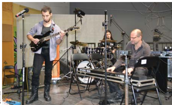
Występ zespołu rockowego, poprzedzający zabawę karnawałową

KURIER SZKOLNY | KACPER LACHOWICZ NA BAJKOWEJ