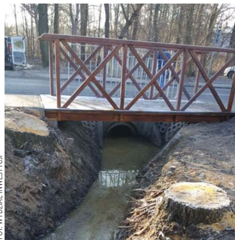
Mostek nad kanałem w Aleksandrowie

Zbudowany został w Aleksandrowie chodnik wzdłuż ul. Złotej Jesieni oraz kładka nad kanałem. W tymże osiedlu doposażony został plac zabaw położony na terenie filii Wawerskiego Centrum Kultury.