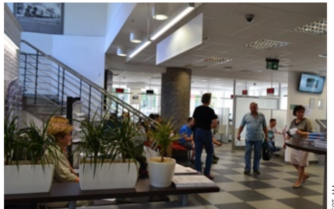
Więcej niż trzy czwarte uczestników badania dobrze oceniło jakość obsługi interesantów w Urzędzie Dzielnicy

70 proc. ankietowanych podkreśliło, że władze Wawra realizują potrzeby mieszkańców, 67 proc. – że władze orientują się, jakie mieszkańcy mają problemy. 64 proc. badanych dobrze oceniło pracę burmistrza. Na uwagę zasługuje fakt, że w 2013 r. ten wynik był o 24 proc. gorszy.