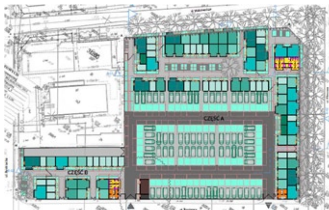
Wizualizacja falenickiego targowiska niedalekiej przyszłości

zył realizacji celów kulturalnych, społecznych i integracyjnych w tym osiedlu. Prawie 570 tys. zł przeznaczono na wykonanie projektu budowlano – wykonawczego wraz z przebudową targowiska w Falenicy oraz na zagospodarowanie przyległego zielonego terenu. Jednocześnie zmniejszono nie-