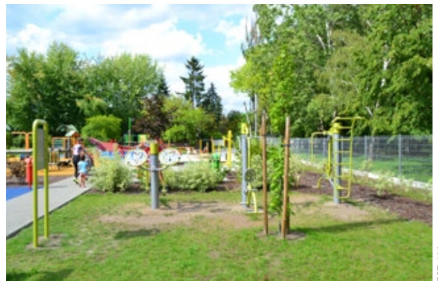
Powiększona część siłowni plenerowej na placu zabaw przy ul. Frenkla w Falenicy

ustawiono kosze na śmieci w Wawrze przy ul. Spółdzielczej, Wodzisławskiej, Szparagowej, Błękitnej, w Nadwiślu przy Bysławskiej, Kosańca, Czarnuszki, w Międzyzlesiu przy Czatów, Hafciarskiej, Bielszowickiej, w Aninie przy IX Poprzecznej, Pazińskiego, Axentowicza i Zorzy.