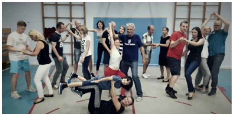
Zajęcia taneczne przy ul. Kadetów w osiedlu Las