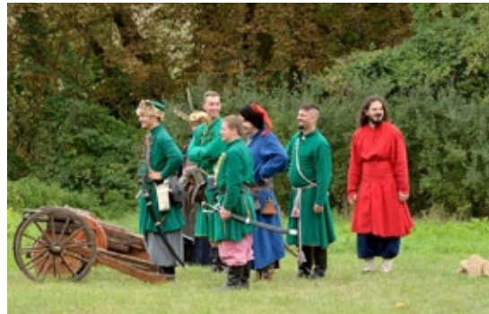
Grupa rekonstrukcyjna, która weźmie udział w imprezie poświęconej sportom, grom i zabawom staropolskim

jów” – wystawa plenerowa poświęcona historii Wawra i osiedli tworzących dzisiejszą dzielnicę. Urząd Dzielnicy, ul. Żegańska 1, Biblioteka Publiczna, ul. Trawiasta 10, Wypożyczalnia nr 26, ul. Błękitna 32, przystanki PKP Międzyzylesie, Radosć, Miedzeszyn.