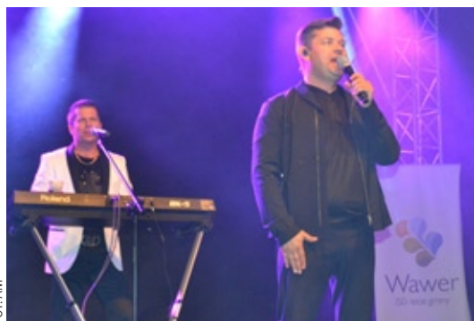
Koncert Zenka Martyniuka przyciągnął wieczorową porą na kościelne błonia co najmniej 3 tys. fanów disco polo