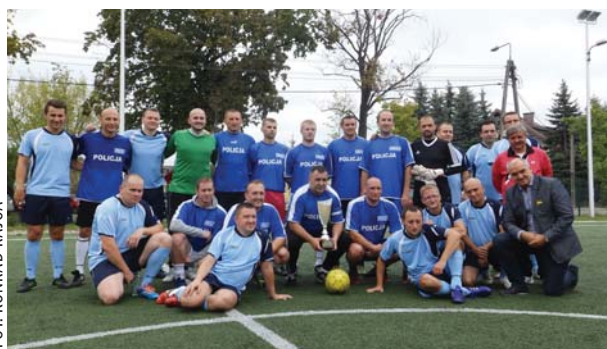
Pamiętkowe zdjęcie po meczu drużyn reprezentujących Policję i Urząd Dzielnicy