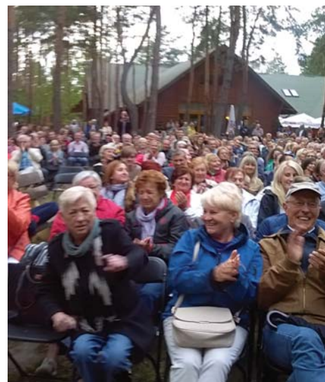
Mieszkańcy mieli powody do zadowolenia

mniej znany, pokazał kilka interesujących scenek i jest chyba szansa na to, że przebije się nawet na telewizyjny ekran. Nie byłby to pierwszy taki przypadek po udanym debiucie w Wawrze.