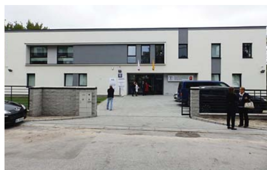
Tak prezentuje się nowa marysińska przychodnia zdrowia

Przychodnia przy ul. Begonii zastąpi przychodnię ulokowaną dotąd przy ul. Korkowej, gdzie warunki dla personelu i pacjentów są dalekie od norm. Nowy obiekt ma nieco ponad 900 m kw. powierzchni i dwie kondygnacje. Mieści w sobie gabinety lekarzy dziecięcych, podstawowej opieki zdrowotnej, stomatologię (będą nocne dyżury dentystyczne). Na piętrze przewidziano pomieszczenie, z którego będą korzystać w ciągu dnia