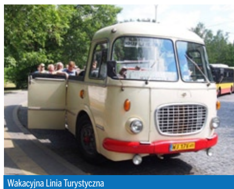
Wakacyjna Linia Turystyczna