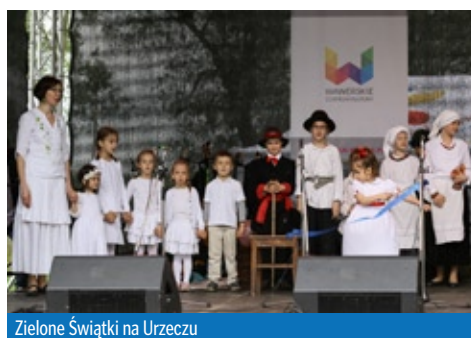
Zielone Świątki na Urzeczcu