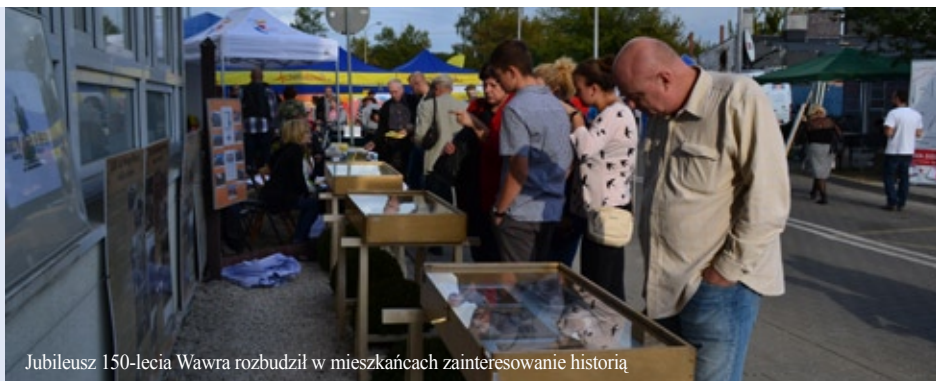
Jubileusz 150-lecia Wawra rozbudził w mieszkańcach zainteresowanie historią