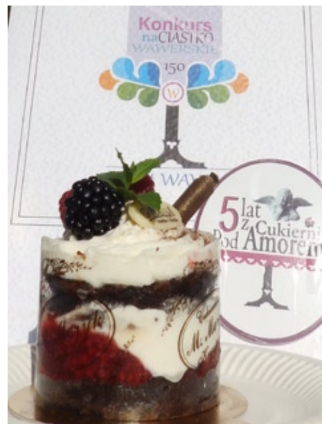
Wawerskie Ciastko z Cukierni Meryk wyłonione w głosowaniu mieszkańców