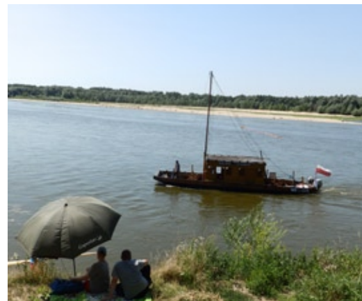
Takim promem bezpłatnie na wilanowską stronę Wisły przepływali się piesi i rowerzyści

Przeprawę promową do osiedla Zawady po zachodniej stronie Wisły obsługiwała jednostka „Św. Barbara” Fundacji Szerokie Wody do wczesniej jesieni. Inna jednostka pływająca realizowała program edukacyjno-ekologiczny.