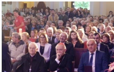
Gośćmi koncertu byli kardynał Kazimierz Nycz i arcybiskup Henryk Hoser