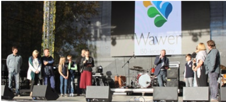
Sprawdzian z wiedzy o Wawrze i jego historii

A wieczorem odbył się koncert Ryszarda Rynkowskiego. Przed laty mieszkańca osiedla Wawer. W czasie trwającego półtorej godziny występu Ryszard Rynkowski przypomniał wawerskim fanom swoje największe przeboje.