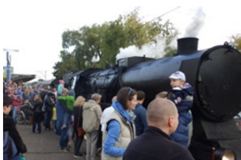
Przejazd parowym pociągiem