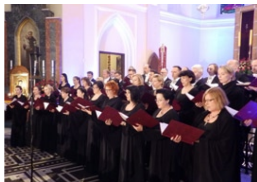
Chór Filharmonii Narodowej

Zerzeński koncert był inauguracją projektu „Mazowsze w koronie”, na który składały się muzyczne