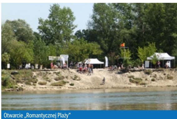
Otwarcie „Romantycznej Plaży”