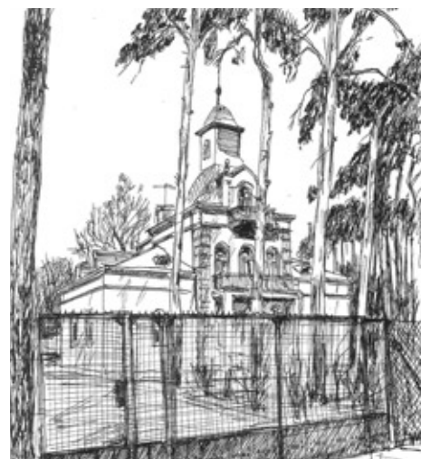
Jedna z ilustracji jubileuszowego kalendarza na 2016 r.

Wystawę można było oglądać przez dłuższy czas. Cieszyła się dużym zainteresowaniem osób odwiedzających Urząd Dzielnicy.