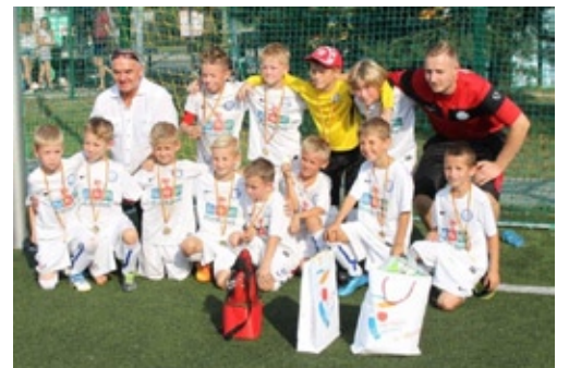
Młodzi piłkarze szkółki KS ZWAR, którzy wygrali turniej w Nadwiślu