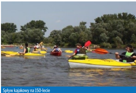
Spływ kajakowy na 150-lecie