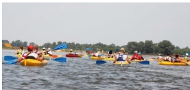
Na spływ kajakowy 150-lecia Gminy Wawer wybrało się ok. 250 osób

Po meczu był czas na grilla. Tak wyglądała inauguracja „Romantycznej Plaży”, autorskiego projektu