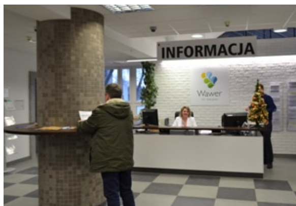
Wchodzących do Urzędu Dzielnicy wita stanowisko informacji