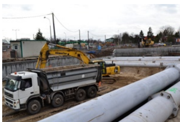
Rozpoczęło się pogłębianie wjazdu do tunelu po stronie wschodniej torów kolejowych

Dalej, w kierunku zachodnim, gdzie biegną zjazd i wyjazd z tunelu, w pierwszych dniach lutego zamontowano między ścianami bocznymi rury rozporowe na