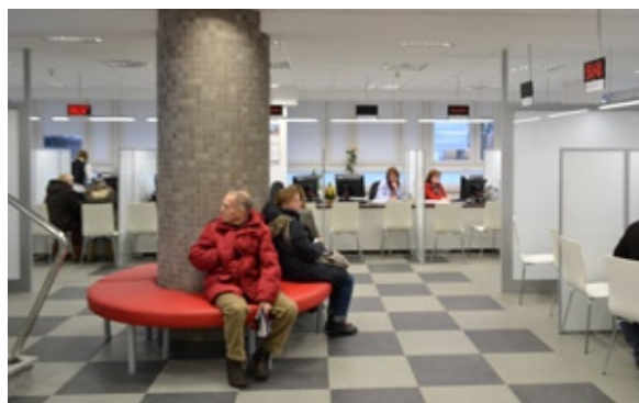
W zasięgu wzroku są stanowiska obsługowe i monitory informacyjne