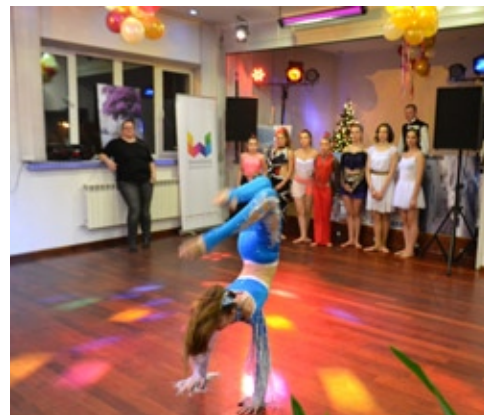
Młodzi tancerze pokazali uczestnikom balu, jak się tańczy nowoczesnie

Jest szansa, że dzięki temu balowi uda się w tym roku zorganizować wyjazd podopiecznych do... Grecji właśnie. Zaproszony na bal ambasador tego kraju nie mógł, niestety, przybyć na tę zabawę, ale w nadesłanym liście podziękował za zaproszenie i zapewnił, że przedstawicielstwo