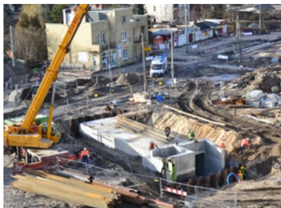
Półowa betonowej konstrukcji podziemnego przejścia pod rondem na wysokości ul. Dworcowej

czas dalszych prac, takich jak utwardzanie podłoża. Wkrótce podobne roboty będą wykonywane po wschodniej stronie torów. Tam jest już gotowa betonowa konstrukcja pochylni i podziemnego przejścia dla pieszych oraz ścieżki rowerowej, prowadzących na stronę wschodnią torów i na perony stacji kolejowej Międzyzlesie.