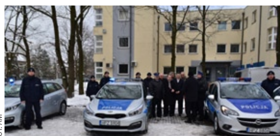
Te pojazdy zasiliły tabor wawerskiej policji