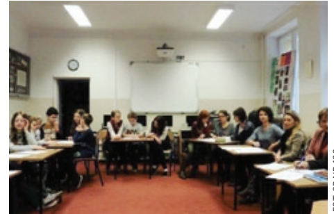
Uczniowie przedstawili swoje postulaty, rodzice i nauczyciele - swoje

dokumentem, zapisany jest zakaz korzystania z telefonów, uczniowie chcieliby zmienić to prawo. Po długich dyskusjach ustalono, że po feriach będą wprowadzone przerwy z grami ruchowymi zamiast elektronicznymi, dzwonienie do domu ma się odbywać z sekretariatu i świetlicy. Wolny dostęp do telefonu uczniowie wynegocjowali na długiej przerwie w piątek – wtedy będą mogli grać w gry i surfować w internecie, oczywiście z poszanowaniem zasad cyberbezpieczeństwa. Na korytarzach zostaną powieszony zegary, by to na nich móc sprawdzać godzinę – dla dzieci komórki to także... zegarek. Wnioski przedstawiono dyrekcji, a Rada Rodziców zakupiła miękkie piłki do wykorzystywania