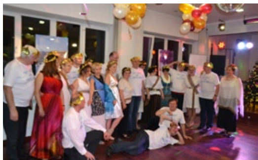
Złote liście laurowe na skroniach, panie w chlamidach, panowie w koszulkach z napisem „Mam ciało jak grecki bóg”