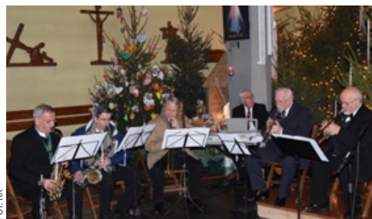
Koncert na inaugurację obchodów 150-lecia gminy Wawer w kościele w Aninie

KURIER URZĘDOWY | DLA POPRAWY BEZPIECZEŃSTWA