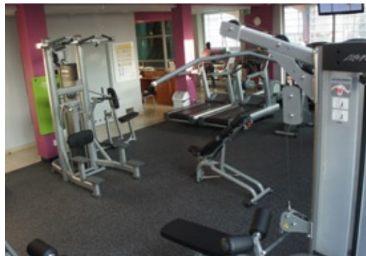
Tak nowoczesnych urządzeń do ćwiczeń wytrzymałościowych, modelujących sylwetkę, nie spotkacie w tzw. sieciowych siłowniach

Część obiektu wawerskiego Ośrodka Sportu i Rekreacji w Aninie, w której oferowane są zajęcia siłowe, treningowe, przeszła ostatnio radykalną