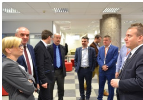
Zmodernizowany wydział obsługi mieszkańców odwiedzili przedstawiciele Urzędu m.st. Warszawy