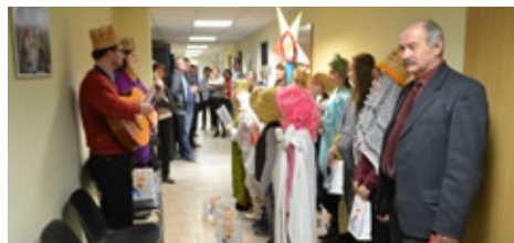
Koład w wykonaniu uczniów wysłuchał m.in. wiceburmistrz Zdzisław Gójski

Dużą niespodziankę interesantom oraz pracownikom Urzędu Dzielnicy sprawili uczniowie z Zespołu Szkół nr 116 przy ul. Korynckiej. Wystąpili w roli kołędniczków. Poprzez bierani, z tradycyjną gwiazdą, zatrzymywali się na każdym piętrze