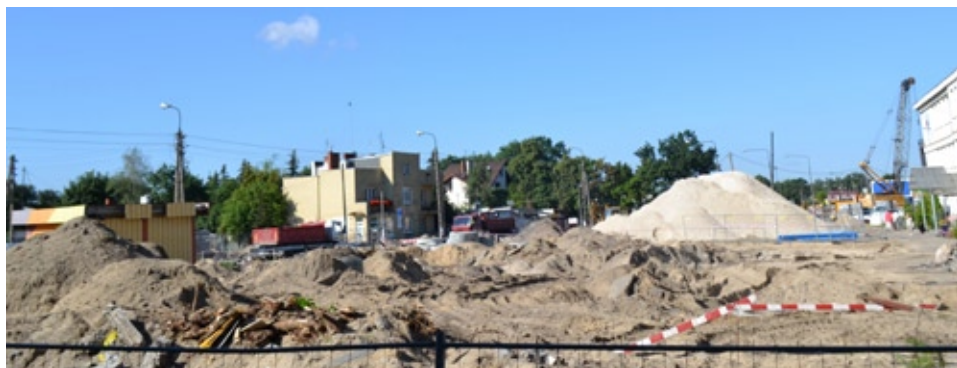
Księżycowy pejzaż w miejscu przyszłego ronda na wprost ul. Dworcowej i zjazdu do tunelu

strony ul. Rogatkowej, po położeniu ostatniego odcinka kolektora ściekowego W trwa odtwarzanie starej części ul. Zwoleńskiej, która jednak zmieniła nieco kierunek, aby połączyć się z tunelem i rozdzieliła, tworząc odnogę będącą lokalną drogą,