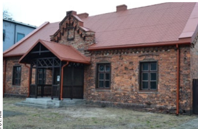
To mogłoby być miejsce na Muzeum Wawra

– Ideą muzeum jest powstanie centrum historycznego dzielnicy, wiedzy o niej, jej ludziach, wydarzeniach – mówi. Tym bardziej, że w przyszłym roku obchodzona będzie 150 rocznica powstania gminy Wawer. I przypomina, że Muzeum Wawra istniało w 1942 r.