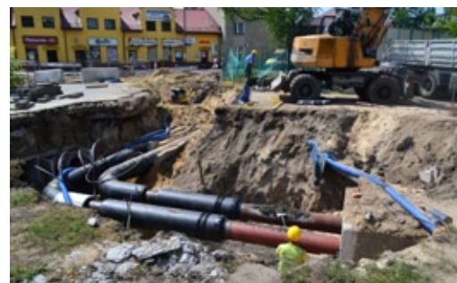
Roboty ciepłownicze w pobliżu zakwalifikowanego do przebudowy ronda przy ul. Pożaryskiego

Przy stacji PKP Międzylesie wykonane zostały ściany szczelinowe i wybrano ziemię w miejscu, gdzie jest robione podziemne przejście na perony. Po zachodniej stronie centrum Międzylesia, od