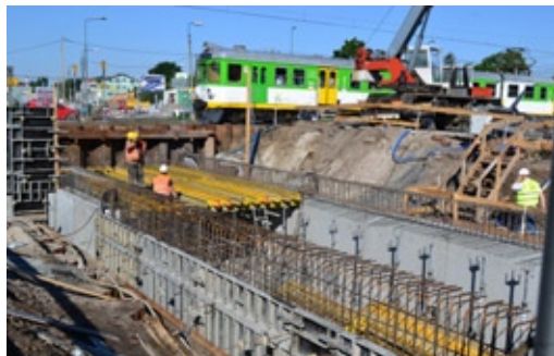
Trwa budowa przyszłego podziemnego przejścia na perony stacji PKP Międzyzlesie

Zbliża się termin odbudowania Zwoleńskiej i Mrówczej i wybudowania nowego ronda,