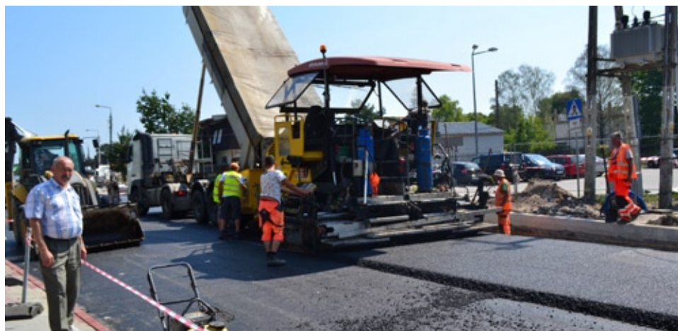
Asfaltowaniem odbudowywanej ul. Zwoleńskiej zainteresowany był zastępca burmistrza Zdzisław Gójski (z lewej)

większego niż było do niedawna. Dopiero po tym wykonawcy tunelu będą mogli przedłużyć kolektor W pod torami do wschodniej jezdni ul. Patriotów, gdzie połączy się z kanałem ściekowym idącym od strony Falenicy i przejść z budową tunelu na zachodnią nitkę Patriotów.