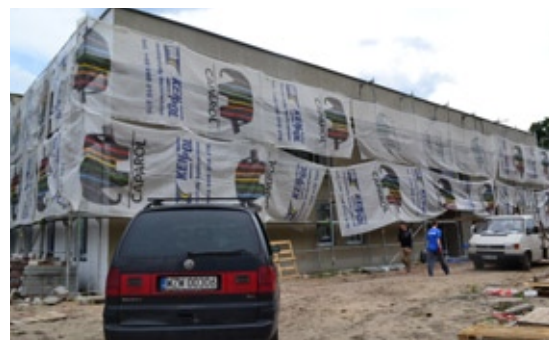
Na ścianach wewnętrznych są już położone tynki, które trzeba jeszcze pomalować zgodnie z wizją architekta

jeszcze straszy surowy beton, podobnie z glazurą. Podwieszony sufit jest tylko w części budynku, tam gdzie go nie ma widać odsłonięte przewody, na przykład wentylacyjne. Ściany zewnętrzne co prawda otynkowano, ale nie są jeszcze pomalowane.