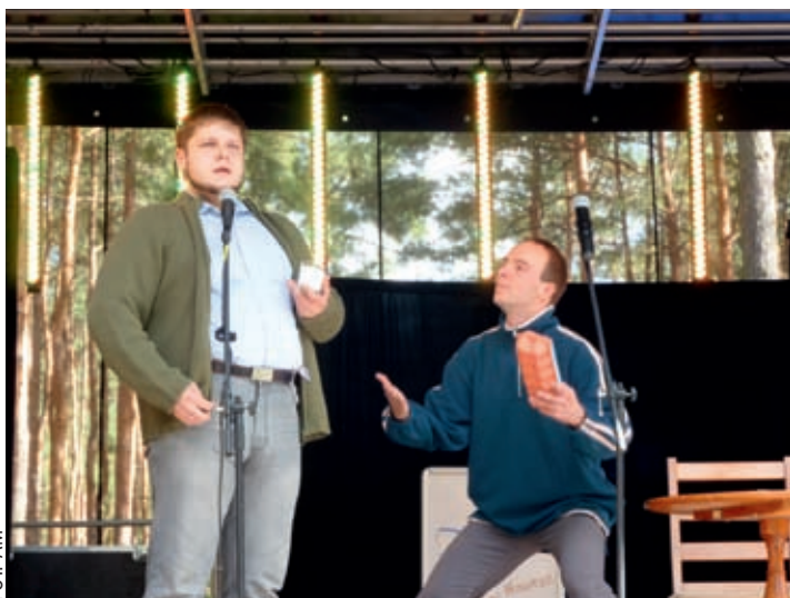
DABZ w skeczu z sąsiadem