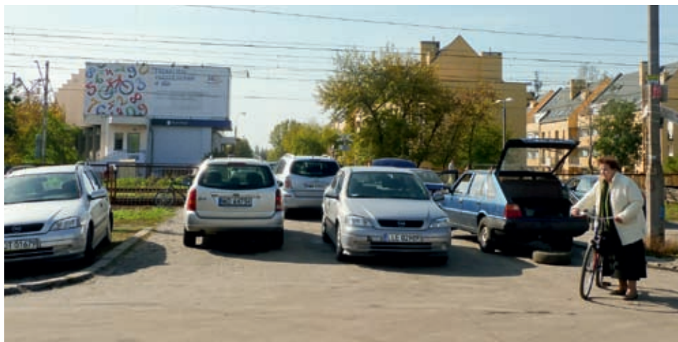
Przebiecie ul. Korkowej bezkolizyjnym tunelem pod linią kolejową usprawniłoby komunikację na obszarze Marysina Wawerskiego