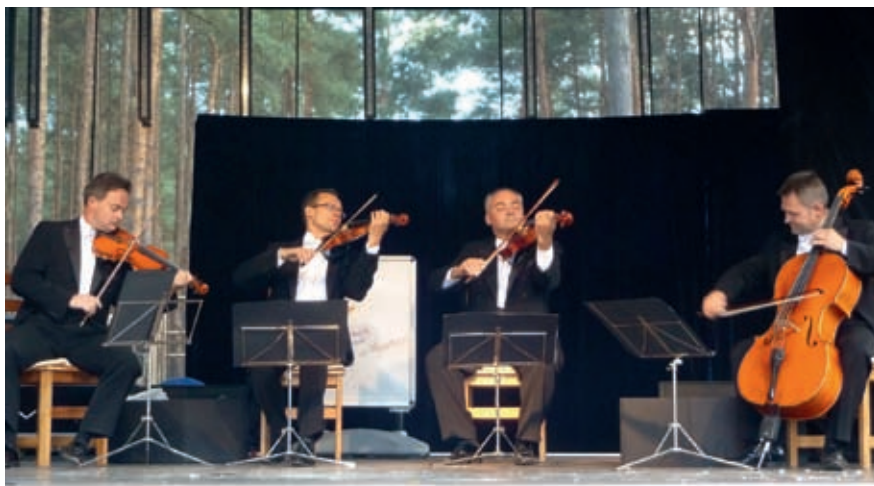
MoCarta, kabaret o niewyczerpanych pokładach pomysłów

• Dopisała publiczność – na VIII Wawerskie Spotkanie Kabaretowe 9 września na teren zielony miedzeszyńskiego hotelu Boss przyszło prawie 1000 osób, z których każda za bezpłatną wejściówkę ofiarowała książkę dla dzieci i młodzieży.