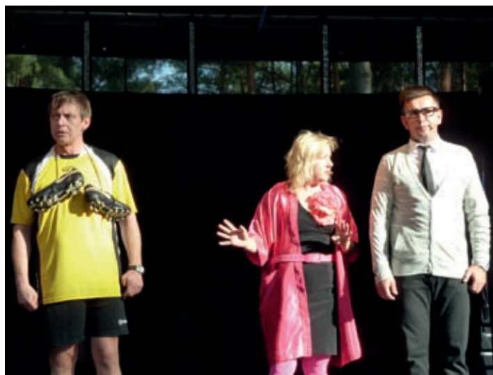
Jurki w programie „Album rodzinny”