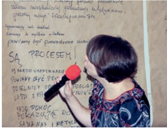
Spotkanie konsultacyjne w Kinokawiarni Stacja Falenica

Ich pierwszym elementem była dyskusja nad przyszłym kształtem dzielnicowej kultury z udziałem