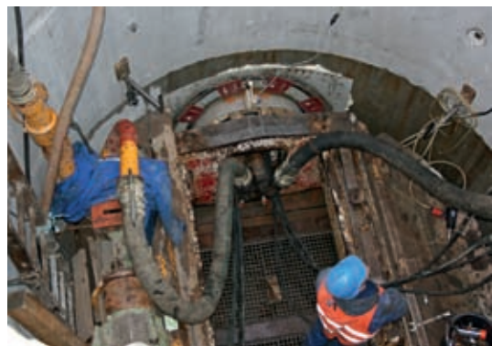
Tak wygląda praca w szybie

Pod ul. Zwoleńską pracuje na razie jedna tarcza, docelowo będą dwie. Mieszkańców interesuje, dlaczego kręgi wpuszczane w miejsca, dokąd będą dochodzić kanały doprowadzające ścieki z boków, są jednolite. Otóż takie są na początku. W momencie kiedy dociera do nich tarcza, przewierca również ich ścianki. Otwory na doprowadzenie ścieków będą wykonywane w odpowiednim momencie.