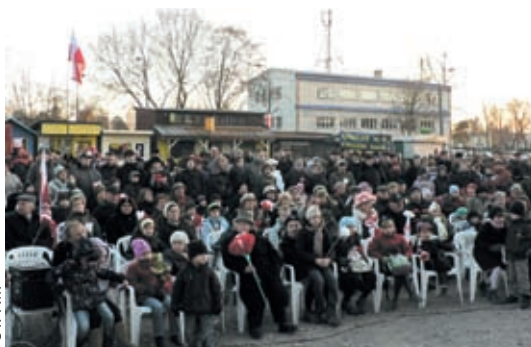
Tłumy mieszkańców Falenicy i innych osiedli Wawra uczestniczyły w patriotycznej uroczystości z okazji Święta Niepodległości

KURIER HISTORYCZNY | MŁODZIEŻ O WALCE Z KOMUNIZMEM