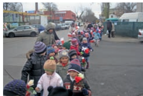
Przedszkolaki w drodze do pamiątkowej tablicy