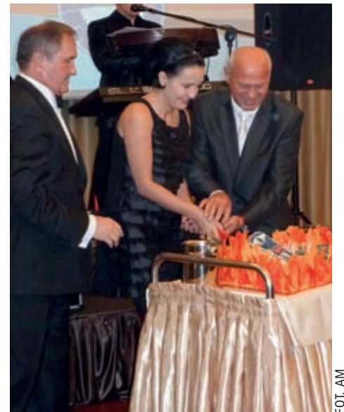
najlepszych kontrahentów na uroczystość do Klubu Sosnowego przy Trakcie Lubelskim, gdzie odbyła się

Z każdym rokiem działalność „Walogu” rosła i ani się kierownictwo oraz pracownicy spozbrzegli, firmie stuknęło 20 lat. Z tej okazji jubilat zaprosił swoich