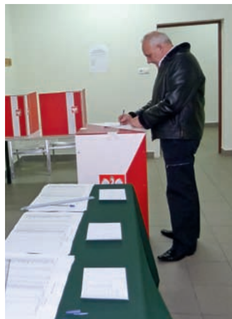
Jedna z najniższych była frekwencja w obwodzie obejmującym Marysin Północny

Frekwencja w poszczególnych osiedlach była bardzo zróżnicowana, co przedstawia wykres. Były osiedla, w których mieszkańcy narzekali na brak informacji o wyborach i takie, w których o wyborach przypominali parafianom księża podczas mszy. „Kurier Wawerski” poświęcił kampanii wyborczej po jednej stronie w dwóch numerach poprzedzających 18 listopada, pisały o nich inne lokalne gazety. Trudno więc zgodzić się z twierdzeniami, że nie zadbano o informację przedwyborczą.