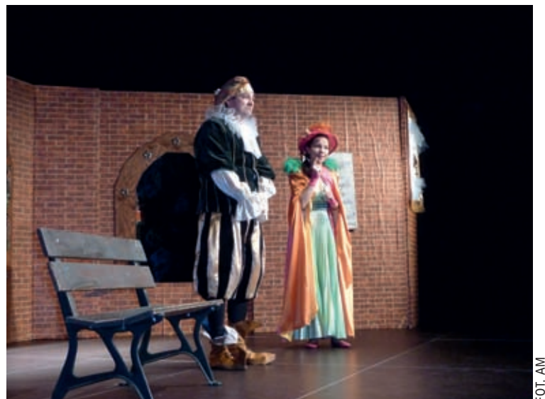
Gdy odwiedziliśmy Projekt Teatr Warszawa, wystawiano w nim „Pożarcie królowy Bluetki”, spektakl dla dzieci oglądany przez przedszkolaków z placówki przy ul. Jordanowskiej