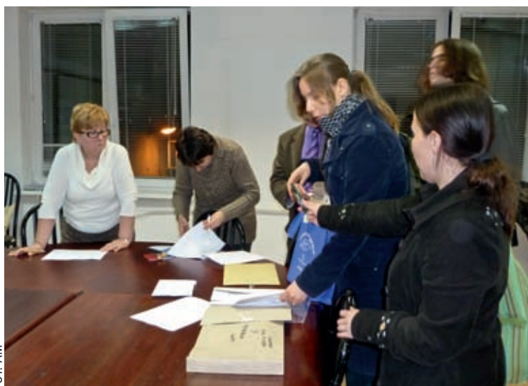
Po godz. 19 przeliczone głosy z komisji obwodowych trafiały do dzielnicowej komisji wyborczej. Na zdjęciu z prawej członkowie z komisji wyborczej z Marysina Wawerskiego Południe