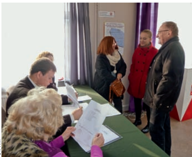
Lokal wyborczy w Miedzeszynie. Głosujący przychodzili falami, tak jak kończyły się msze w kościele