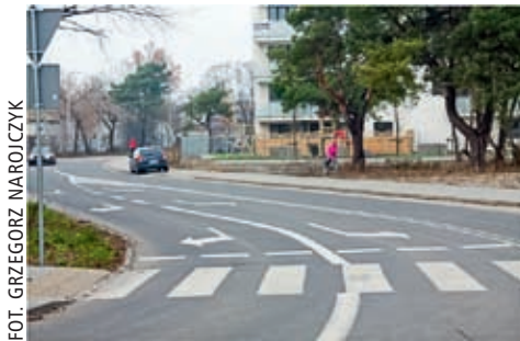
Zaprojektowano w ciągu dwóch lat ponad 40 organizacji ruchu drogowego, jak to na ul. Mozaikowej przy Bysławskiej

W latach 2011–2012 dzielnica opracowała ponad 40 projektów organizacji ruchu na własnych ulicach (większe arterie, jak ul. Patriotów, ul. Trakt Lubelski, ul. Bronisława Czecha, Wał Miedzeszyński podlegają Zarządowi Dróg Miejskich). Dotyczyły one podporządkowania, wprowadzenia znaków zakazu zatrzymywania i postoju w miejscach niebezpiecznych, lokalizacji przejść dla pieszych. Objęto nimi ulice: Cylichowską, Czeladniczą, Potockich, Petunii, Świebodzińską, Zorzy, Mydlarską, Podmokłą, Cedrową, Strusia, Dworcową, Oliwkową, Petunii, Podkowy, Poezji, Przewodową, Ślimaka, Trakt Lubelski, Tytoniową, V Poprzeczną, Wilgi, Zagajnikową, Alpejską, Borków, Bysławską, Czolgistów, Walcowniczą, Dzielnicową, Glicynii, Harmonistów, Kwitnącej Akacji, Lucerny, Masłowiecką, Niemodlińską, skrzyżowania Izbickiej z Koszęcińską, Kocką, Żwanowiecką, Rozszerzoną, skrzyżowania Patriotów z Owocową, Śpiewną, Brodniczą, Wspomnień, Zagajnikową, Jeżynową, skrzyżowania Oleckiej z Brzostowską i Początkową. Wydano na ten cel 220 tys. zł. Wykonane zostały odpowiednie, asfaltowe, nawierzchnie na ul. Derkaczy, Radłowej, Oliwkowej, Margerytki, dokończono ul. Mozaikową do Bysławskiej. Na te inwestycje poszło prawie 4,7 mln zł. Wykonano kosztem 700 tys. zł ścieżkę