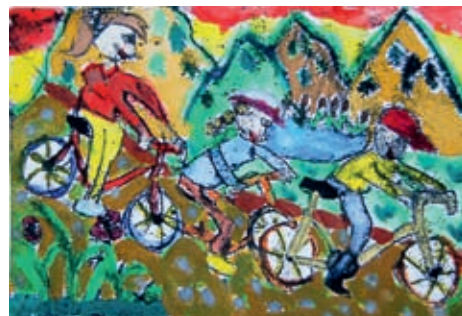
Jedna z ciekawych prac