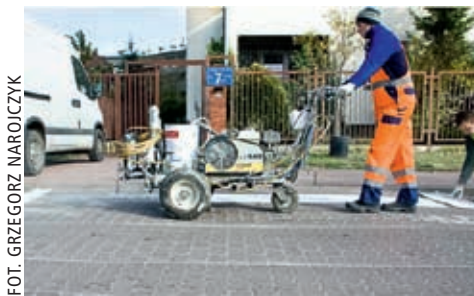
Odnowione i uzupełnione zostały oznakowania pionowe i poziome na wawerskich ulicach

rowerową wzdłuż ul. Wydawniczej. W tym roku rozpocznie się budowa odcinka ul. Świebodzińskiej do Międzyleskiego Szpitala Specjalistycznego, I etapu ul. Panny Wodnej, chodnika wzdłuż ul. Technicznej.