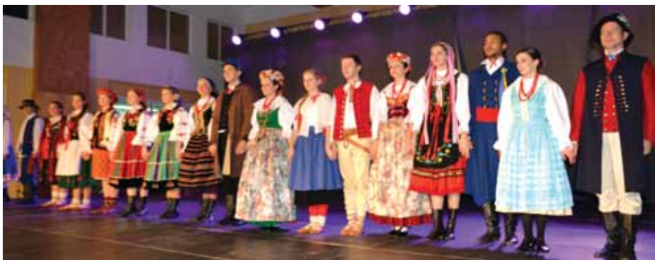
Zespół Pieśni i Tańca Politechniki Warszawskiej w pełnej krasie