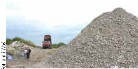
Niedaleko ul. Kadetów w kierunku Zakola Wawerskiego składowano takie haldy gruzu