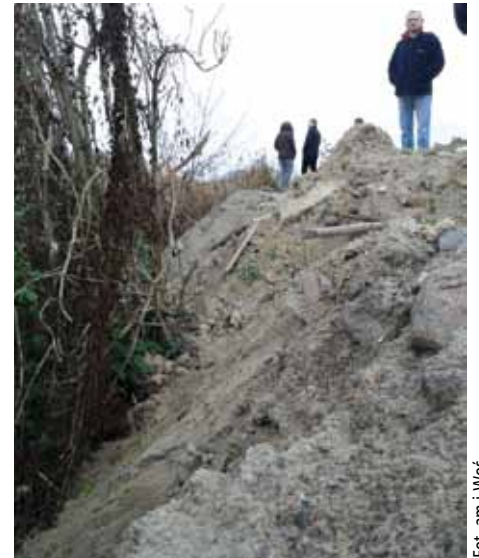
O tyle został podwyższony teren obok domów spółdzielni mieszkaniowej ZWAR. To „składowanie” odpadów ziemnych kosztuje już właściciela kilkanaście milionów złotych

Tylko w dwóch przypadkach nie będziemy obciążeni opłatami wynikającymi z ustawy o odpa-