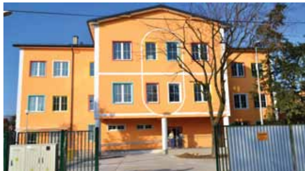
Przedszkole w osiedlu Las: trzy kondygnacje, 8 oddziałów, ok. 2 tys. m kw. powierzchni

– Kiedy przed 19 laty zostałam mieszkanką Wawra, a później prezydentem Warszawy,