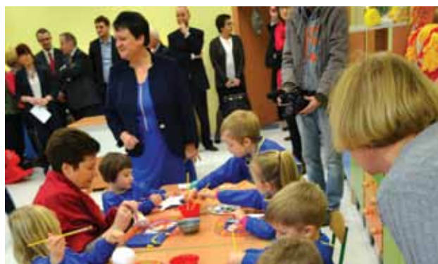
Prezydent Hanna Gronkiewicz – Waltz przyłączyła się do dzieci wykonujących ozdoby choinkowe i malujących bombki