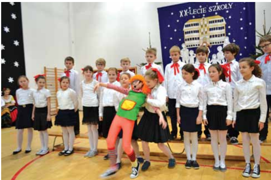
Szkołę odwiedziła Pippi Pończoszanka, przeskadzająca, jak to ona, w prowadzeniu zajęć