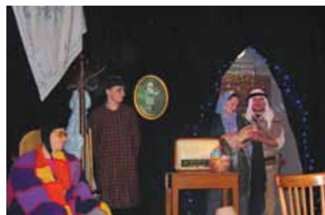
Teatr Rodziców Przedszkola „Leśny Zakątek” wystawił spektakl pt. „Jasełka na strychu”