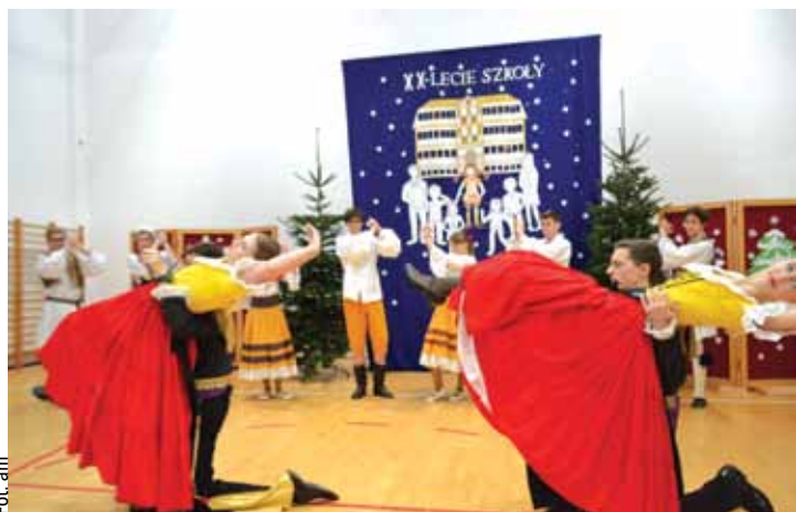
Imprezę jubileuszową rozpoczął mazur, a zakończyła wiązanka tańców z różnych stron świata

PSP nr 92 jest szkołą wymagającą – mówią