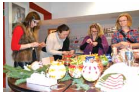
Warsztaty rękodziela ludowego cieszyły się dużym powodzeniem

Ten wielogodzinny kolbergowski wieczór zakończył się wspólnym śpiewaniem najpopularniejszych piosenek ludowych.