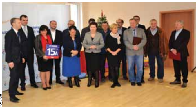
Goście w towarzystwie pracowników wyróżnionych za właściwe przeprowadzenie tej inwestycji