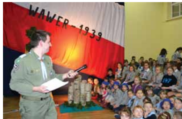
Uroczystość przygotowali harcerze z zuchami Szczepu 147 WDH „Błękitni”