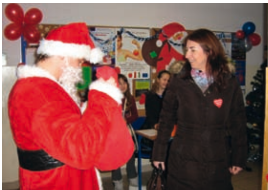
Czynny udział w pomnażaniu wpływów na Wielką Orkiestrę Świątecznej Pomocy miał św. Mikołaj

Uczniowie obu prywatnych placówek zaprezentowali noworoczny koncert, śpiewając piosenki, ja-