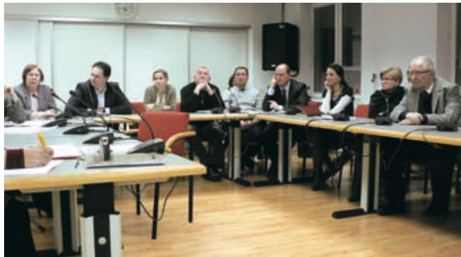
Plan dla zachodniej części Radości wzbudził duże zainteresowanie mieszkańców, czego potwierdzeniem był liczny ich udział w posiedzeniu komisji ładu przestrzennego Rady Dzielnicy

Ul. Patriotów po tej stronie torów przewidziana jest jako ulica główna, zbiorczymi będą ciąg Mozaikowa – Mrówcza, ul. Panny Wodnej i Prze-