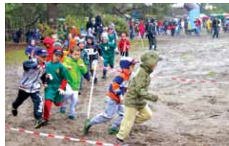
Biegają chłopcy z najmłodszej grupy wiekowej

Na starci stanęło prawie 750 biegaczy, od zupełnych maluchów, którzy ścigali się na dystansie 100 m, po osoby dorosłe i w sile wieku. W biegach nie premiowano zwycięzców, rozlosowano natomiast nagrody wśród wszystkich uczestników. Każdy z nich otrzymał na mecie certyfikat, potwierdzający udział w tej imprezie.