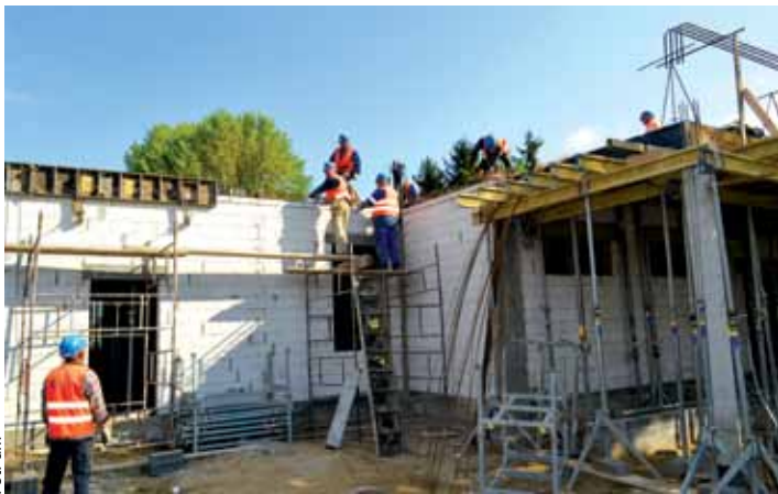
Taki stan osiągnęła budowa przedszkola w osiedlu Las w pierwszym tygodniu maja