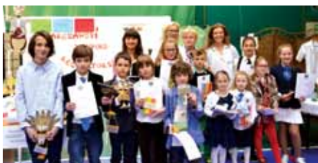
Grupowe zdjęcie laureatów z jurorami, pierwsi trzej z lewej to zwycięzcy w swoich grupach wiekowych

KURIER KULTURALNY | KONCERTY, PRELEKCJE, PROJEKCJE