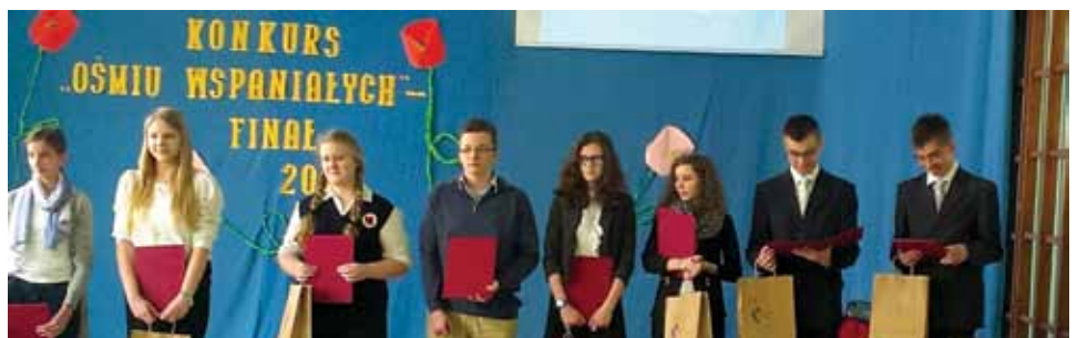
Laureaci tegorocznego konkursu