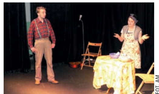
Bardzo dowcipny spektakl o zamianie ról męża i żony