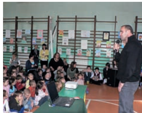
Przemysław Saleta zasypany gradem pytań

To tylko niektóre z zadawanych pytań. Przemysław Saleta pokazał uczniom utrwalone na elektronicznym nośniku pierwsze zwycięskie walki na zawodowym ringu, nagrane jeszcze w technice czarno – białej. Dzieci wręczyły mu nagrodzony w konkursie portret oraz najsympatyczniejszy wiersz o nim. A na koniec sportowiec wykonał ciężką pracę – podpisał dziesiątki, jak nie setki autografów.