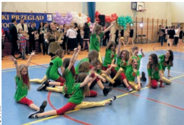
Bardzo dobrze zaprezentowała się grupa taneczna ze Studia Tańca Duet

Trybuny – pełne miłośników tańców nowoczesnych, rodziców. Wokół parkietu – wianuszek tych, którzy oczekując na swój występ, podpatrywali, jak prezentuje się konkurencja. Barwne na ogół stroje, dodatki, nawet makijaże, bez których trudno zrobić wrażenie na widzach i na jurorach. Muzyka – ostra, faktycznie nowoczesna, hiphopowa, ale nie tylko. I niepowtarzalna atmosfera, a na parkiecie ruch, szal, ekspresja, breakdance, skoki, szybkie zwroty akcji.