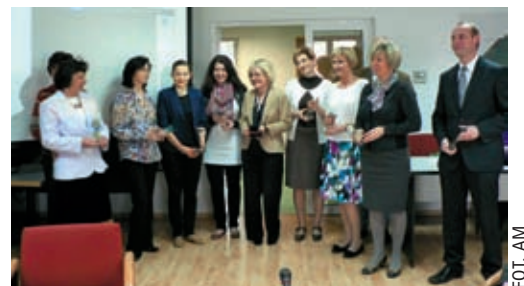
Nauczyciele wyróżnieni przez Zarząd Dzielnicy za przygotowanie warsztatów