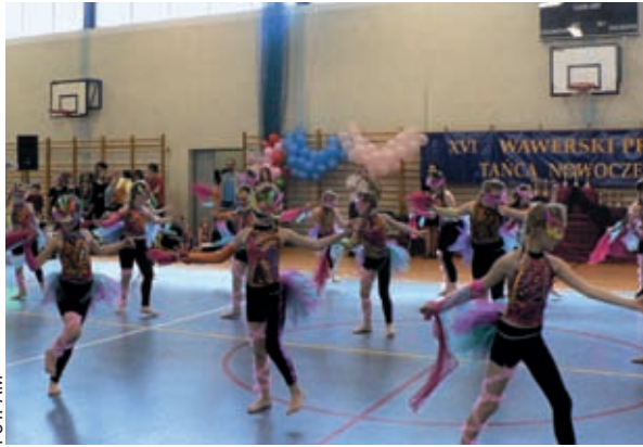
Swoje umiejętności prezentuje, skrywając się za maskami, zespół „Alexia Dance Studio 1”, działający przy SP nr 109 w Zerzeniu

● Ponad 700 uczestników w 46 zespołach wzięło udział w tegorocznym, szesnastym już Wawerskim Przeglądzie Tańca Nowoczesnego, zorganizowanym przez Klub Kultury Marysin w hali sportowo-widowiskowej Zespołu Szkół nr 115.