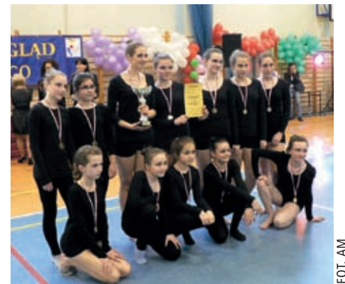
„Incognito” z KK Zastów to zdobywca II miejsca

Kat. open: zespół „Alexia Dance Studio” z Domu Kultury „Świt”.